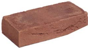
Mississippi Donkerrood HV