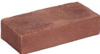
Mississippi Donkerrood VB