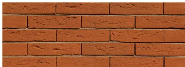
Zambezi Oranje HV