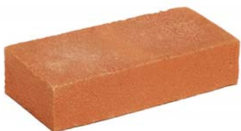
Zambezi Oranje VB