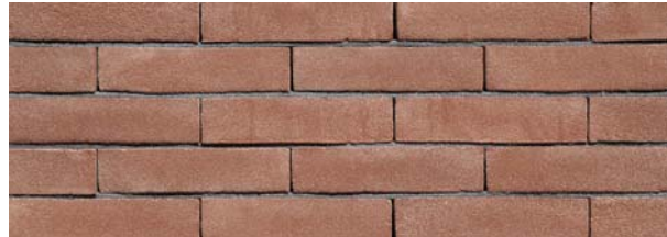
Nijl Rood VB