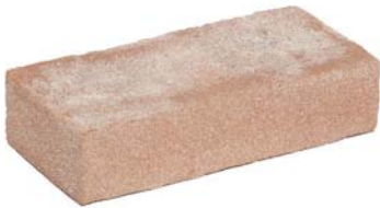
Nijl Rood VB