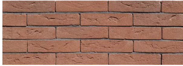
Nijl Rood HV