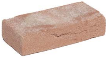
Nijl Rood HV