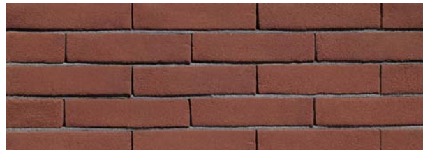
Mississippi Donkerrood VB