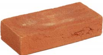
Zambezi Oranje HV