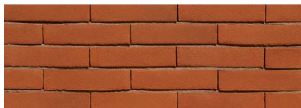
Zambezi Oranje VB