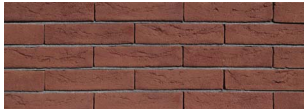
Mississippi Donkerrood HV